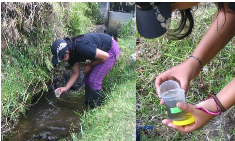
Figura 2. Toma de muestras de agua utilizando un recipiente sencillo.