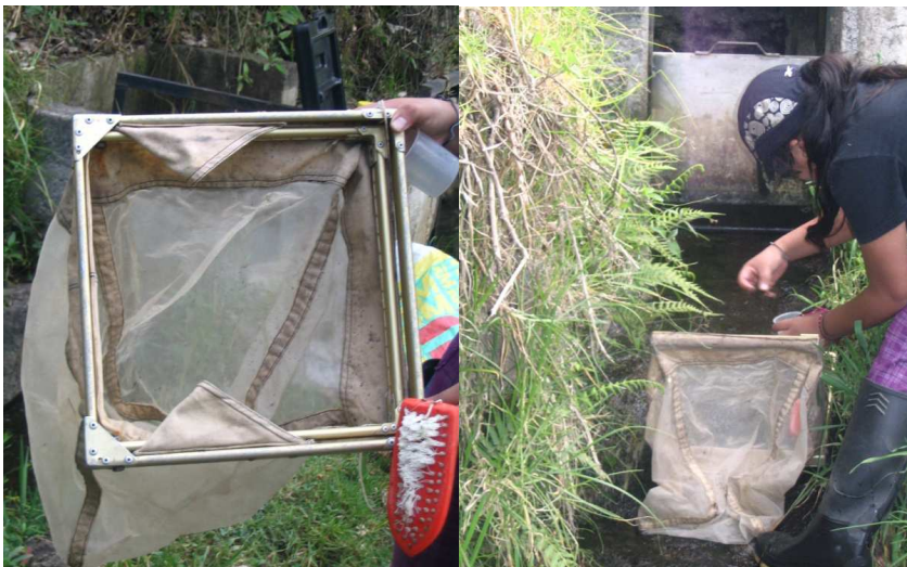
Figura 1. Red Surber utilizada como método cuantitativo para la captura de plancton.

totales suspendidos (partículas suspendidas en las muestras de agua por ser insolubles), y un Termómetro.