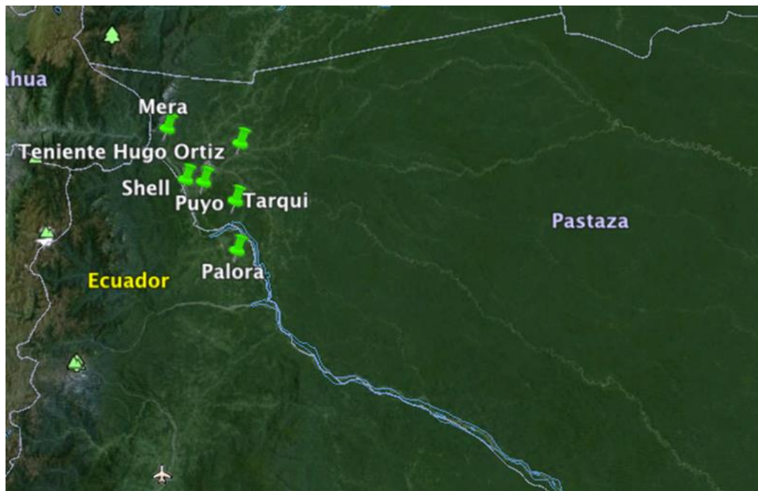
Figura 2. Parroquias de las Provincias de Pastaza y Morona Santiago abordadas en el presente estudio.