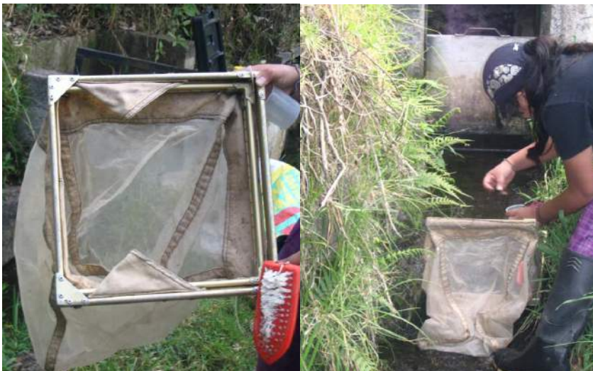
Figura 1. Red Surber utilizada como método cuantitativo para la captura de plancton.

totales suspendidos (partículas suspendidas en las muestras de agua por ser insolubles), y un Termómetro.