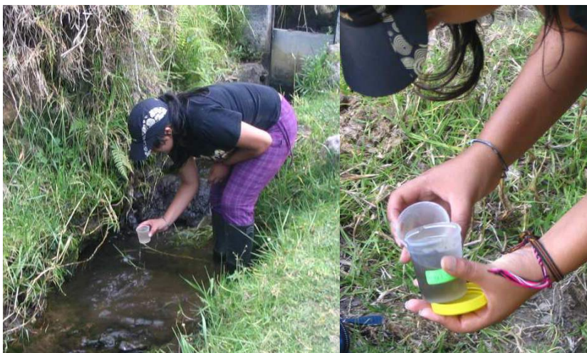
Figura 2. Toma de muestras de agua utilizando un recipiente sencillo.