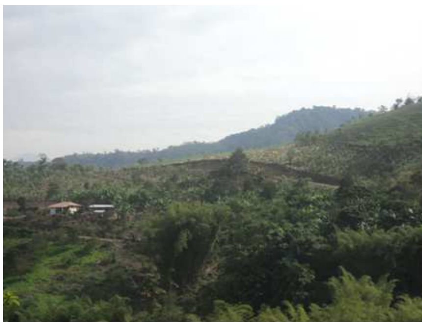
Figura 1. Agrosistema en el noroccidente del Distrito Metropolitano de Quito: Nanegal. Fotografía por: Patricio Yáñez, julio 2012.