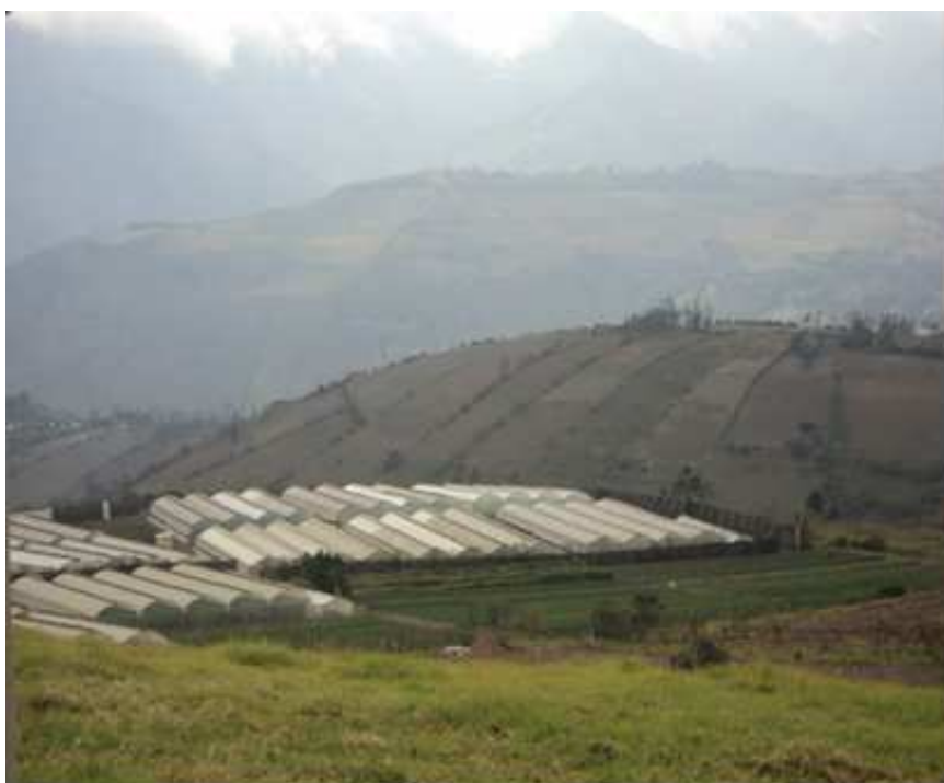
Figura 3. Agrosistema hacia el este del Distrito Metropolitano de Quito: Invernaderos en Puéllaro. julio 2012.