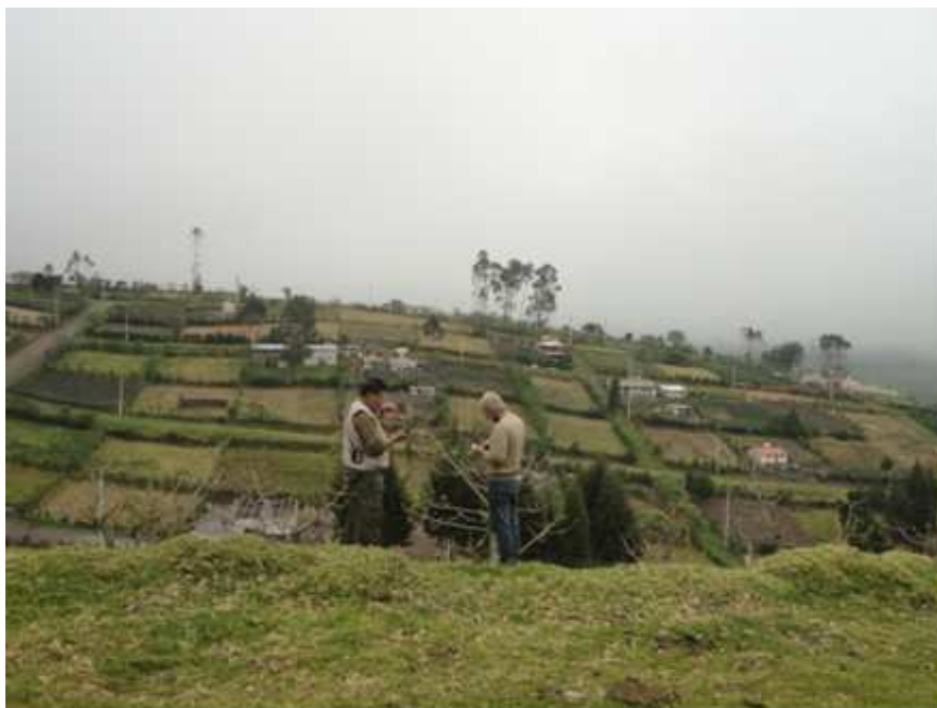
Figura 2. Agrosistema en el suroccidente del Distrito Metropolitano de Quito: Lloa. Fotografía por: Carolina Robalino, julio 2012.